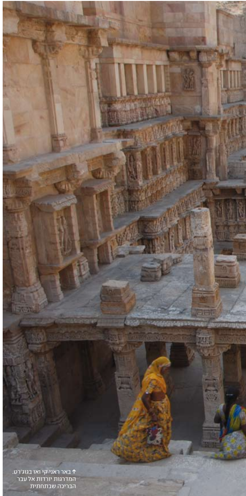
↑ באר ראני קי ואו בגוג'ר'ט. המדרגות יורדות אל עבר הבריכה שבתחתית

בארות המדרגות הראשונות הוקמו במאות 6-7 לספירה, ובמאה ה-11 הגיעה הארכיטקטורה שלהן לשיאה. לצד מתחמי הבארות, שהתפתחו מבחינת הגודל והפאר, הוקמו בתקופה הזאת גם השערים המרשימים לפני המדרגות, שהדגישו את הנקודה שבה מתחיל המבקר את מסעו אל מתחת לפני הקרקע. בתקופות