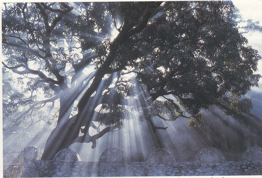
→ מימין: פסל של בודהא † למעלה: עץ פיקוס שתחתיו ישב בודהא כאשר הגיע להארה