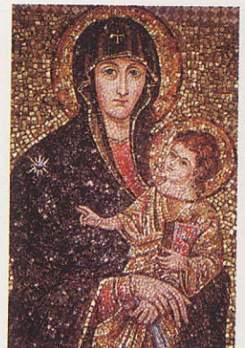
▲ תמונת פסיפס שנתרמה לכנסיית דורמיציון. על קירות הקריפטה תלויות תמונות של מרים, כולן תרומות ממדינות העולם

סיפורים על נשים שייחלו לבנים והיו לאמהות גדולות מכתרים את ימיה ואת חומותיה של ירושלים. בברית החדשה מסופר שלאחר שהרתה בביתה שבגליל, הלכה מרים לעיר קטנה ביהודה המזוהה כיום עם עין כרם. בעין כרם היא ביקרה את אלישבע קרובתה ההרה ואת זכריה, לימים הוריו של יוחנן המטביל, מי שהטביל את ישו במי הירדן. ליד המעיין שלב הכפר (שנקרא מעיין מרים) נפגשות מרים ואלישבע, והנה הילד בבטנה