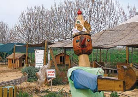
דרך העץ. הפעלה אקטיבית בעץ