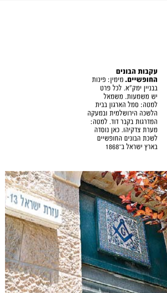
עקבות הבונים החופשיים. מימין: פינות בבניין ימק"א. לכל פרט יש משמעות. משמאל למטה: סמל הארגון ובית הלשכה הירושלמית ובמעקה המדרגות בקבר דוד. למטה: מערת צדקיהו. כאן נוסדה לשכת הבונים החופשיים בארץ ישראל ב-1868

חמישי, 18.8, 16:30, פתוח לקהל הרחב ללא השלום