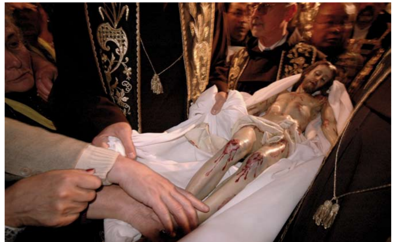
↑ לאחר שהוסר צלם ישו מהצלב נושאים אותו בתכריכים אל אבן המשיחה האחרונה