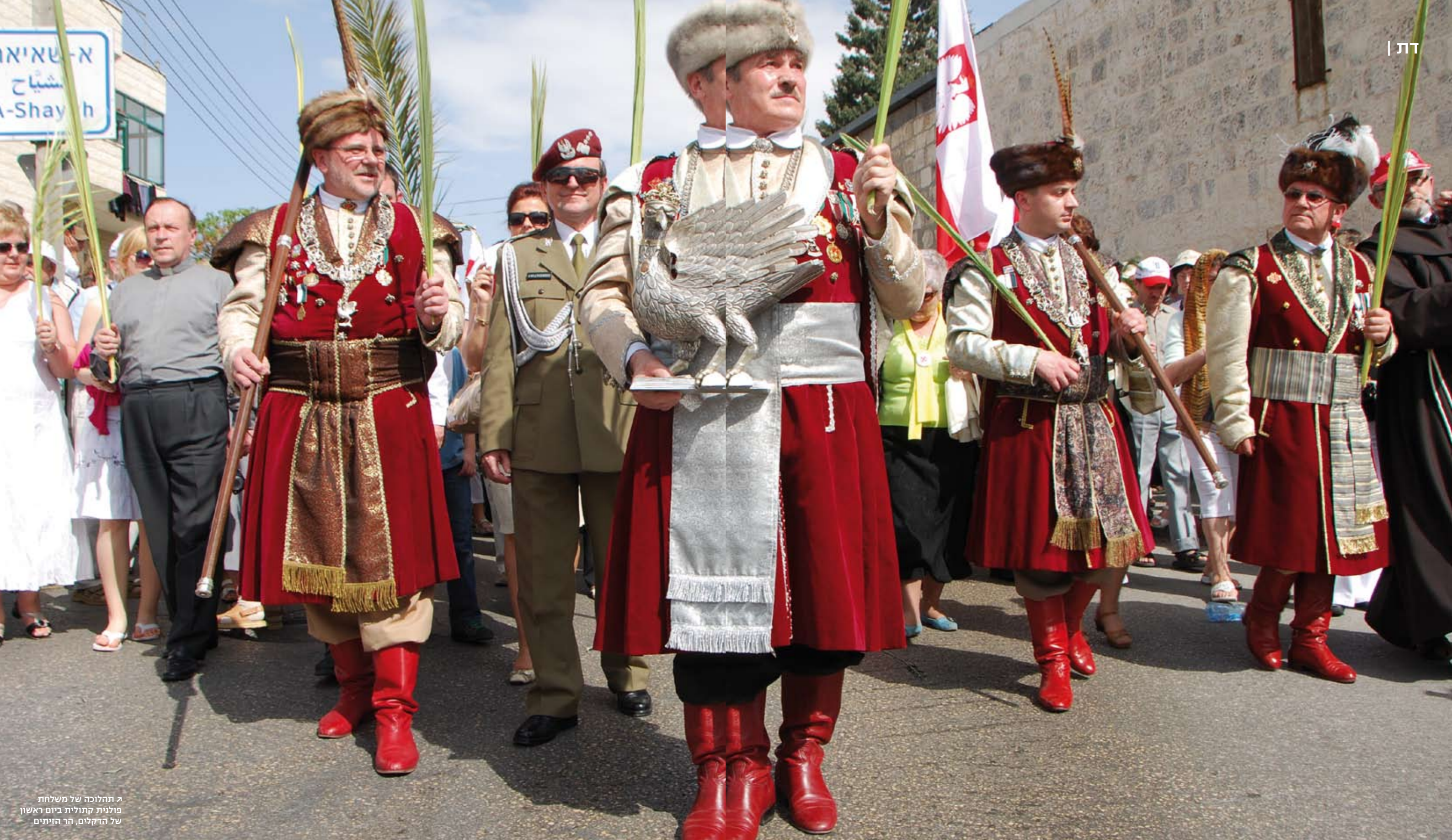
ג. תהלוכה של משלחת פולנית קתולית ביום ראשון של הדקלים, הר הזיתים