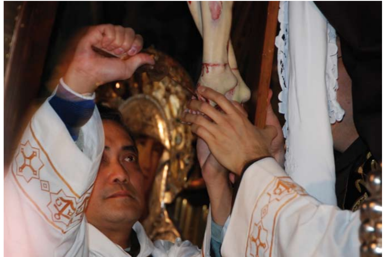
↑ הוצאת המסמרים מרגליו ומידיו של צלם ישו בטקס הפרנציסקני הקתולי. הטקס, המתקיים ביום שישי הטוב, משחזר את אירועי הצליבה