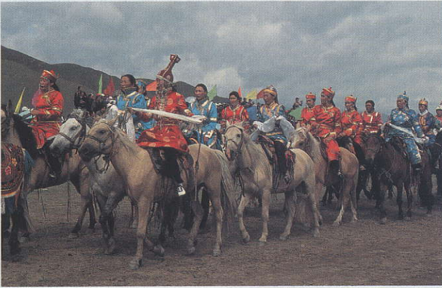
↑ מונגולים רוכבים על סוסים אציליים בַּתְּהִלּוּכַת חג הַנְּאָדָּאָם