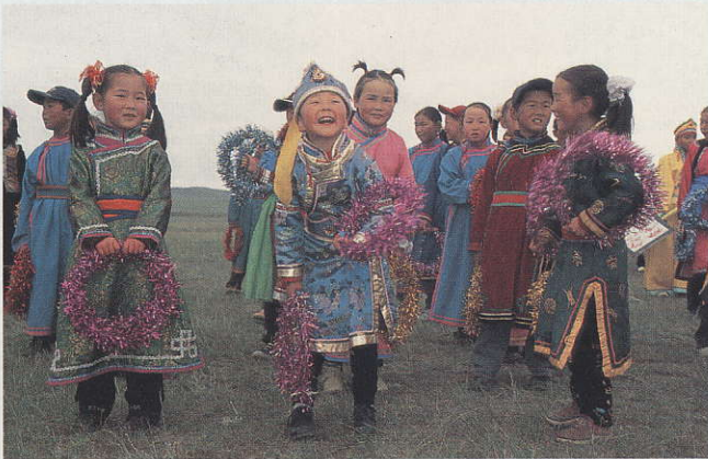
↔ ילדים בלבוש מונגולי מסורתי בַּמְהַלֵּךְ חג הַנְּאָדָּאָם. מדי קיץ, כשהעשב מוריק, נַעֲרַכַת חגיגה גדולה מלוּוּה בַּשִּׁירָה וּבַרִיקוּדִים

לִילָדִים הַנְּוֹדִים בְּמִרְכָּז אַסִּיה אִין טלוויזיה או מחשב, ורובם לא ביקרו מעולם בַּעִיר הגדולה. אבל הם יודעים לַאֲרוֹג צֶמֶר, לַחֲבֹץ חֲמָאָה, וּבַעִיקָר - לַרְכּוֹב עַל סוּסִים מְהִירִים