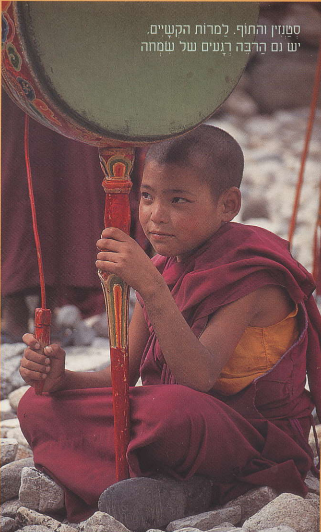
סִטְנִזִּין וְהַתּוֹף. לְמִרוֹת הַקְּשָׁיִים. יֵשׁ גַּם הַרְבֵּה רְגָעִים שֶׁל שְׂמֵחָה