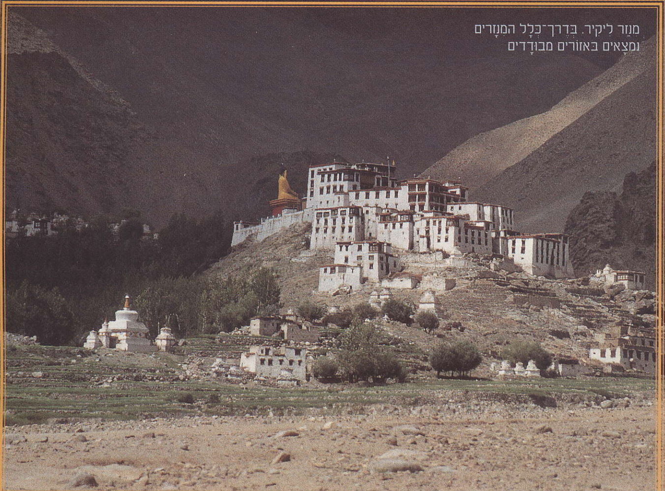
מנזר ליקיר. בדרך־כלל המנזרים ומצאים באזורים מבודדים

לא קל להיות נזיר. במיוחד כשאתה ילד. צריך להסתפק במועט, להקדיש שעות ארוכות בכל יום לתפילה וללימודים. להשתתף בתורנויות ניקיון ובישול. אבל למרות המשמעת הנוקשה, יש רגעים רבים של צחוקים והשתובבויות