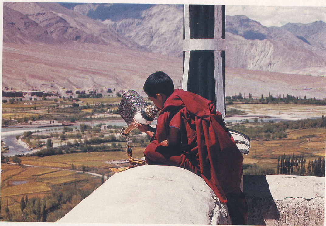
↑ מנזר ספיטוק. נזיר מזמן את חבריו לתפילת הצהריים באמצעות כלי מקונצ'יה