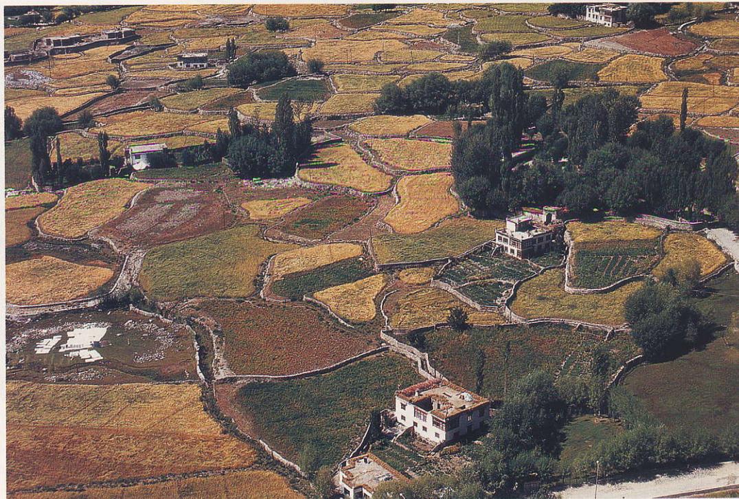
פאתי הכפר צ'נגספה הסמוך ללה. החלקות המעובדות מושקות ברשת ענפה של תעלות מים המוטות מערוצי הנחלים

הלדאקים דומים לטיבטים במראם, בשפתם ובלבושם. חוץ מגלימות הבורדו העוטפות נזירים מקומיים בכל האזור, אין לגברים הלדאקים לבוש מסורתי כלשהו, אבל לעתים הם עונדים תכשיטים. למבוגרים שבהם יש גון עור שחום, והם נראים מבוגרים מכפי גילם. לחלק מהגברים יש שיער ארוך. על צוואר הנשים הנשואות אפשר לראות עדות לדרכי הסחר העתיקות שחצו את האזור מצפון לדרום: ענק הנישואין מורכב מחרוזים עשויים אבני טורקיז, ענבר, אלמוג ופנינים. הטורקיז והענבר מקורם בטיבט, ואילו האלמוג והפנינים מגיעים מחופי הודו. אגב, בלדאק, להבדיל מהודו המוכרת, שורר שוויון בין הגבר לאישה. זהו אחד המקומות היחידים בעולם שבו אישה יכולה לשאת יותר מבעל אחד (לפעמים גם כמה אחים).