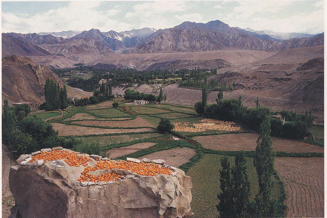
משמשים מונחים לייבוש על סלע בכפר אלצ'י. בעונת החורף הם תוסף חשוב למזון החדגוני