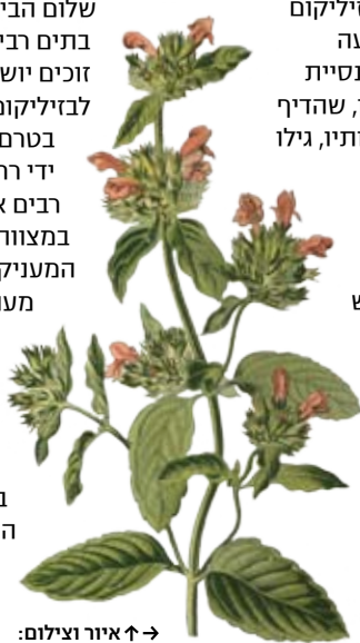
→ איור וצילום: Alamy / Asap

בתיים רבים נשתל צמח הטולסי, הנושא את שמה. כך זוכים יושבי הבית בשומר סף צמודה. לבזיליקום שמור מקום גם במנהגי הדת האסלאמיים. בטרם ייכנסו למסגד, נוהגים המאמינים להיטהר על ידי רחצת פיהם, רגליהם וידיהם במים. במקומות רבים אין מסתפקים במים פשוטים, אלא מהדרים במצווה ורוחצים במים שהושרה בהם בזיליקום, המעניק להם ביטחון עדין. מעניין שגם במחוזות רחוקים כמו קשגאר (Kashgar) שבמערב סין מכנים המוסלמים האיוגורים את הצמח ריחן, כשמו העברי. שם עברי זה, המדגיש את ריחו המיוחד של הצמח, מעיד כי גם בני העם היהודי מכירים בתכונותיו המיוחדות של הצמח, ולפחות בניחוחו הטוב: הריחן נמנה עם הצמחים המשמשים להבדלה במוצאי שבת, המפרידה בין קודש לחול.