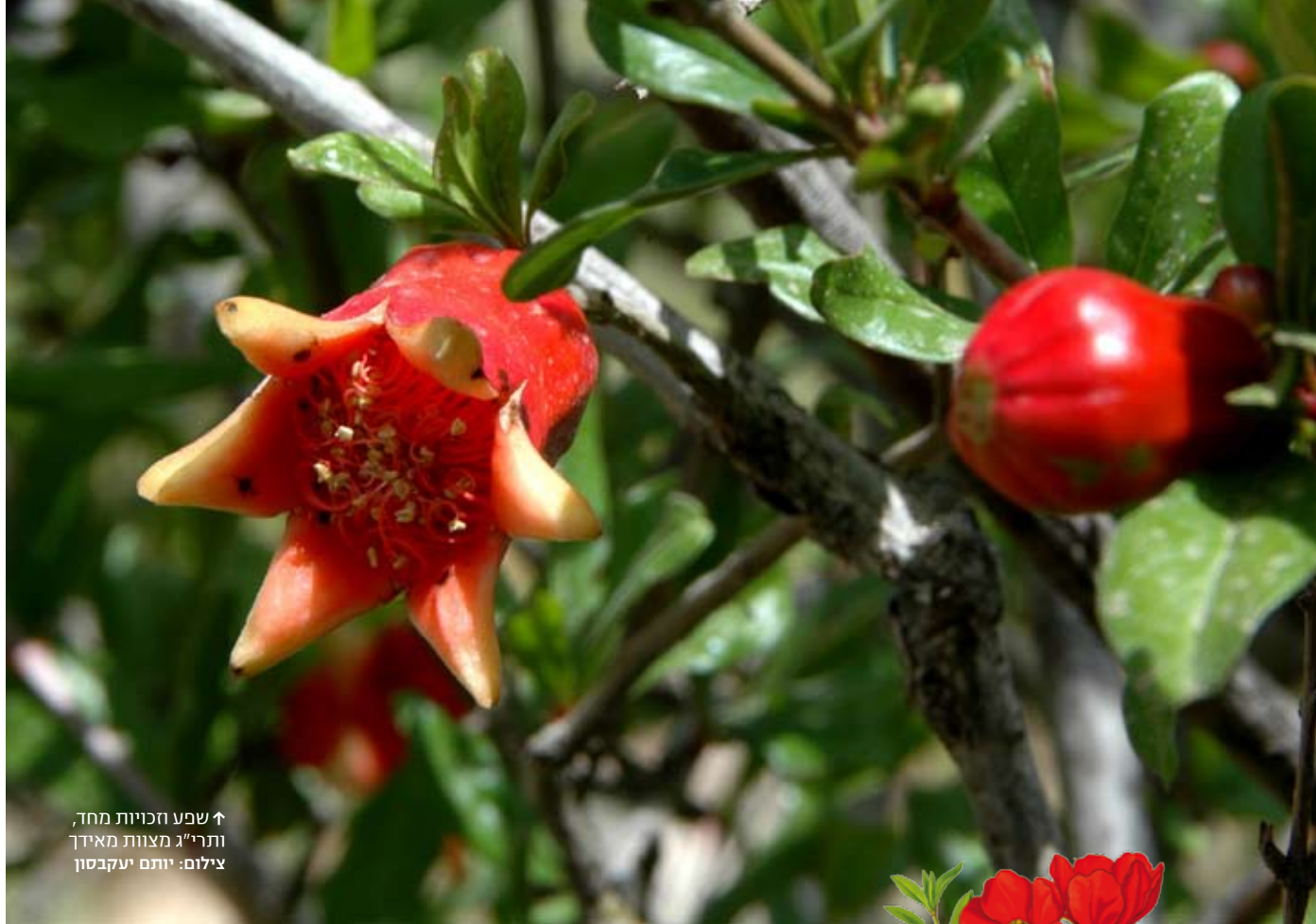
↑ שפע הזכויות מחד, ותרי"ג מצוות מאידך צילום: יותם יעקבסון

מכיל הרימון תרי"ג גרגירים (613), המשולים לכל המצוות שבני ישראל מחויבים בהן. בתרבות יוון הקדומה סימל הרימון נישואים, פריון וחיים, ובד בבד, בכפל משמעות מורכב הדומה לכפל משמעותו של הדם - דם הלידה ודם הפצע - הוא סימל גם את המוות. הרה, אשתו של זאוס ראש האלים, הנחשבת לאלה הראשית המעניקה חיים וגזרת מוות, מתוארת לא אחת כשרימון בידה. גם בסיפור שבו האדס, אל השאול, חטף את פרספונה, מסופר שהאכיל אותה בכמה גרגירי רימון, ואלה זרעו בלבה געגועים עזים אליו. לפיכך, גם כאשר מצאה אותה דמטר אמה והחזירה אותה אל פני האדמה, נגזר על פרספונה לשוב ולשהות עם האדס בשאול במשך כמה חודשים מדי שנה. מכאן נובעים, לפי המיתוס היווני, חילופי עונות השנה, המביאים חיים וזרעים כליה. בארמניה הרימון מוכר כעץ מקודש. המיץ האדום, הדומה לדם, נתפש כקדוש כמו היין, המסמל את מותו של ישו והן את התחייה המובטחת לכל המכיר בו כבן האלוהים. זאת הסיבה שהרימון הוא מוטיב נפוץ ומקובל ביותר בעיטור של כתבי יד ארמניים ובגילופי אבן בכנסיות. בסין המסורתית היה נהוג לנטוע שני עצים בכניסה לכל בית: אפרסק, המסמל את הנצח, ורימון, המבטיח שפע, שגשוג וריבוי צאצאים. בסין של היום, שקיימים בה חוקי ילודה מחמירים, אף על פי שהצבע האדום הוא בעל חשיבות רבה, כבר אין נוטעים רימונים בכניסה לבתים. ©