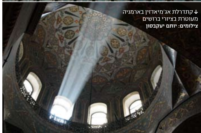
↓ קתדרלת אג'מיאדין בארמניה מעוטרת בצירי ברושים