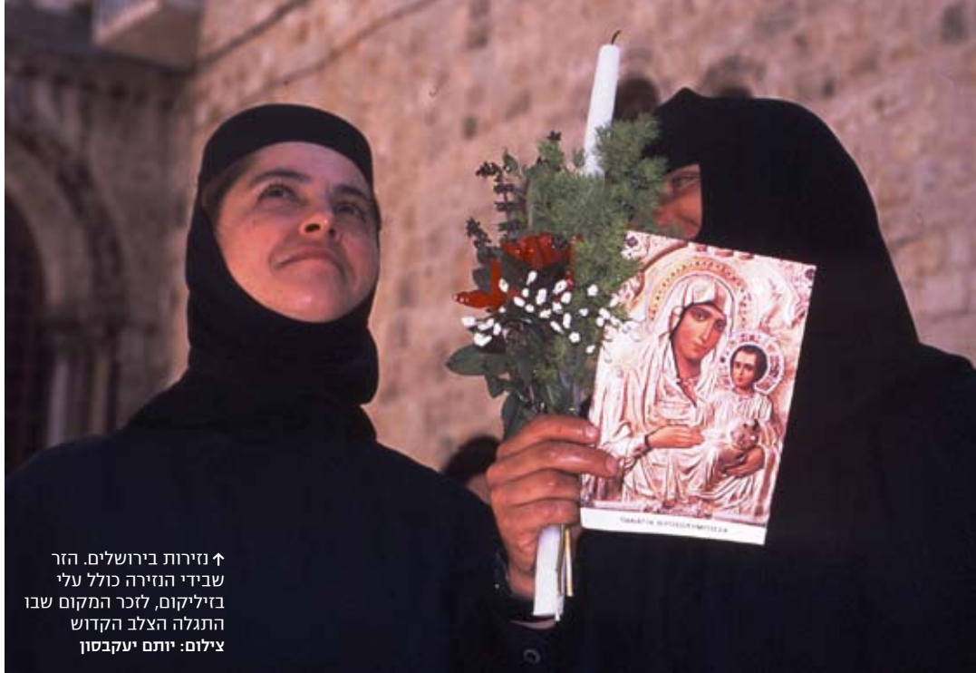
↑ נזירות בירושלים. הזר שבידי הנזירה כולל עלי בזיליקום, לזכר המקום שבו התגלה הצלב הקדוש