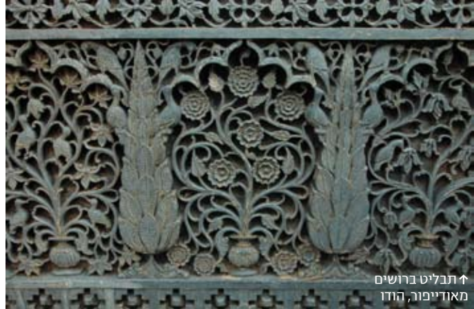
↑ תבליט ברושים מאוזוליון, הודו