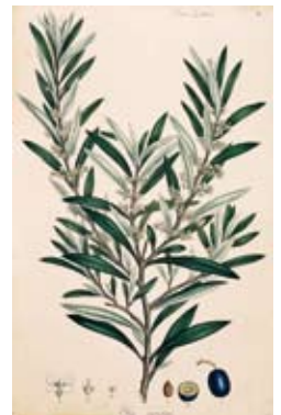
↓ איור: Natural History Museum, London / Alamy / Asap