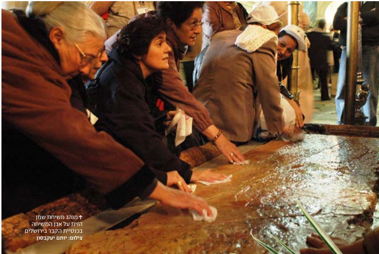
↑ מנהג משיחת שמן הזית על אבן המשיחה בכנסיית הקבר בירושלים

וגבורה רוח דעת ויראת ה' (ישעיהו, פרק י"א, פסוקים א'-ב'). כלומר מוצאו וייחוסו של המשיח נגזרים מאותו מקור - של המשוחים בשמן. לפי המסורת הנוצרית המשיח הוא ישו. לא בכדי ישו נולד, כמו דוד המלך, בבית לחם, והוא מקושר בדרכים נפתלות לאותו ייחוס משפחתי קדום. "משוח בשמן" ביוונית הוא Christos, ומכאן כינויו של ישו, שממנו נגזר גם שמם של הנוצרים בשפות רבות. כפי שמעיד שמם של המאמינים הנוצרים, הם מסמנים עצמם באותו שמן שבו משוח אדונם (כשם שהם נוהגים לסמן את עצמם בדמו ובבשרו, שאותם מסמלים היין והלחם שהכומר מחלק בכל מיסה). ואכן כל נוצרי, עם הגיעו לבגרות ולעיתים גם על ערש דווי, עובר טקס משיחה שבו מצחו או כל גופו נמשח בשמן זית. כדי למשוח מלכים, ולהבדיל גוססים, בשמן הזית, יש למסוק תחילה את הזיתים ולהפיק מהם את שמנם. המינוח "מסיק" לפעולת קטיפת הזיתים הוא כללי ולא מדויק. הפעולה העיקרית בקטיף הזיתים היא הכאת ענפי העץ או ניגור הגזעים הרכים. הפירות נושרים על מחצלת שנפרשה תחת העץ מבעוד מועד. פעולה זו קרויה נקיפה (ממילה זו נגזר שם היישוב בית נקופה וצירופי הלשון נקיפות מצפון ונקיפת אצבע). רק את הזיתים הסוררים מורידים מהעץ על ידי קטיפתם בידיים, ופעולה זו, שהיא תמיד משנית לנקיפה, נקראת מסיק. את הזיתים שמהם ייצרו בעבר את השמן למאור המנורה בבית המקדש קטפו אחד-אחד אגב הקפדה על בדיקתם. פעולה זו נקראה גרגור.