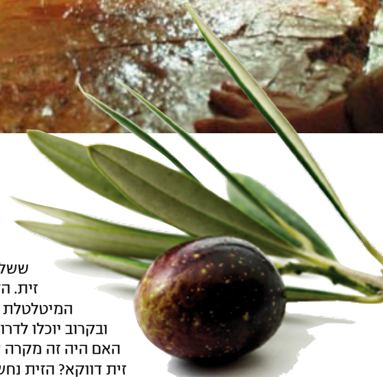
↑ צילום: Maceofoto

עם שוך המבול שבה היונה ששלח נח, ובמקורה ענף קטן של זית. הזית היה אות ליושבי התיבה המיטלטלת על גלים גועשים, שקלו המים ובקורבן יוכלו לדרוך בעצמם על קרקע מוצקה. האם היה זה מקרה שהיונה הביאה עמה ענף של זית דווקא? הזית נחשב לעץ משובח ביותר בזכות פריו שממנו מופק שמן. הוא מזכר בתנ"ך פעמים רבות, ולא אחת מוענקת לו הבכורה מבין כל העצים. חשיבותו של שמן הזית בעבר היתה גדולה עשרות מונים מחשיבותו היום. הוא שימש חומר משמר (עד היום אפשר לראות כדורי לבנה מושרים בשמן זית ומונחים שמורים להפליא גם מחוץ למקרה, למי שתהה אי פעם כיצד הם אינם מתקלקלים), לתעשיית התרופות והבשמים וכמובן גם למאור. לאור חשיבותו זו, לא מפתיע לגלות שהזית הוא העץ הראשון שאליו פנו העצים שביקשו להמשיך עליהם מלך במשל יותם (שופטים פרק ט', פסוקים ח'-ט"ו). הקשר בין זית למלוכה מתבקש, מכיוון שבימי קדם כלל טקס המלכתו של מלך את משיחתו הפיזית בשמן זית. גם המילה "משיח", הדמות העתידה לבשר את אחרית הימים והגאולה, כרוכה בפעולת המשיחה בשמן. לפי הכתוב בספר ישעיהו, המשיח עתיד להיות מבית דוד: "ויצא חטר מגזע ישי ונצר משרשי יפרה: ונחה עליו רוח ה' רוח חכמה ובינה רוח עצה