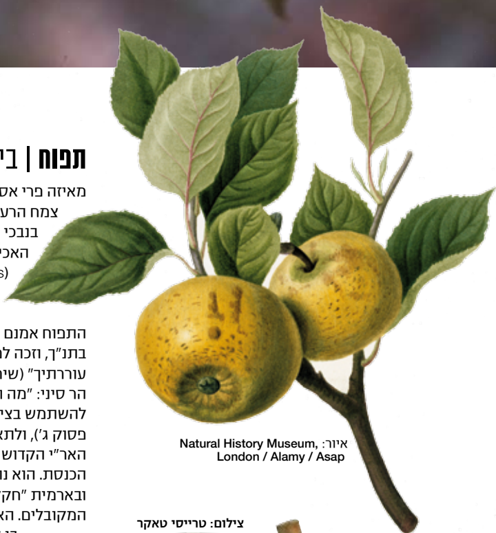
איור: Natural History Museum, London / Alamy / Asap