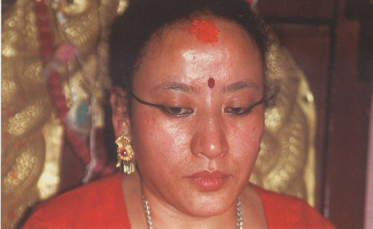
↑ הקומארי המבוגרת בפטאן. היא יושבת בחדר צדדי, על כס הקטן ממידותיה

מכרים ספקנים כשישבנו על כוס צ'אי ושוחחנו. ככל שחלף הזמן עורר הדבר ספקות הולכים וגדלים. היו שציינו כי יש על פניה צלקות של אבע"בועות רוח, והיו שראו תחבושות מגואלות בדם שהוצאו מהבית והוטמנו בחשאי. בינתיים מלאו לקומארי שלושים. היא עזרה בעבודות הבית, אבל לא יצאה ממנו. מפגשה היחיד עם העולם היה הפורחן שהופנה אליה. בנוכחות זרים ומבקרים היא לא דיברה מעולם. גם גודלה הפיזי עורר תרעומת, מכיוון שבאירועים חגיגיים נאלצו לשאתה כמה גברים. אחרים טענו דווקא שגודלה הוא התמזגות אמיתית עם אופי האלה. אלה לא חיפשו אחר סימנים להגעתו של המחזור, ובעיניהם היא היתה לאלה חזקה.