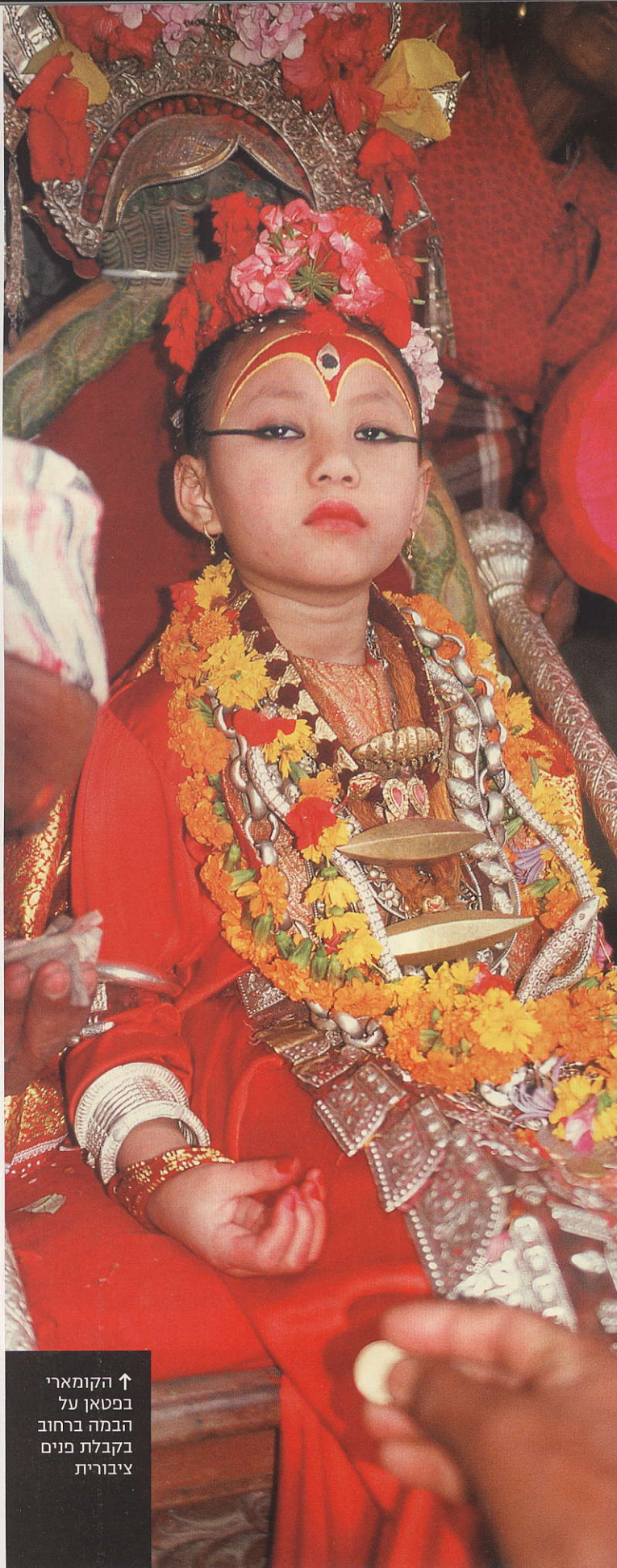
↑ הקומארי בפטאן על הבמה ברחוב בקבלת פנים ציבורית

הזיווג מניב פירות אדמה וצאצאים. יש גם אלות אחרות, למשל שבע האמהות, שמע־ניקות בראש ובראשונה הגנה. יש להן כוח להרוס בצד הכוח לברוא. שלא כמו האלות הקדומות, הן לוחמות חטובות, צעירות ויפות. הן יכולות להיות לעתים מבוגרות, אך הן לעולם אינן הרות. נראה שמקור כוחן טמון בהיותן בתולות, שכן הבתור־לים נתפשים כפוטנציאל לא ממומש, כסכר לעור־צמה אדירה שטמונה בגוף האישה, ולכן גלומה בהם סכנה גדולה. מסיבה זו, ילדה בתולה שעוד לא קיבלה מחזור – כזאת שיכולת הרבייה שלה היא עדיין בגדר פוטנציאל בלבד – היא המתאימה ביותר להכיל בגופה את רוח האלה החזקה.