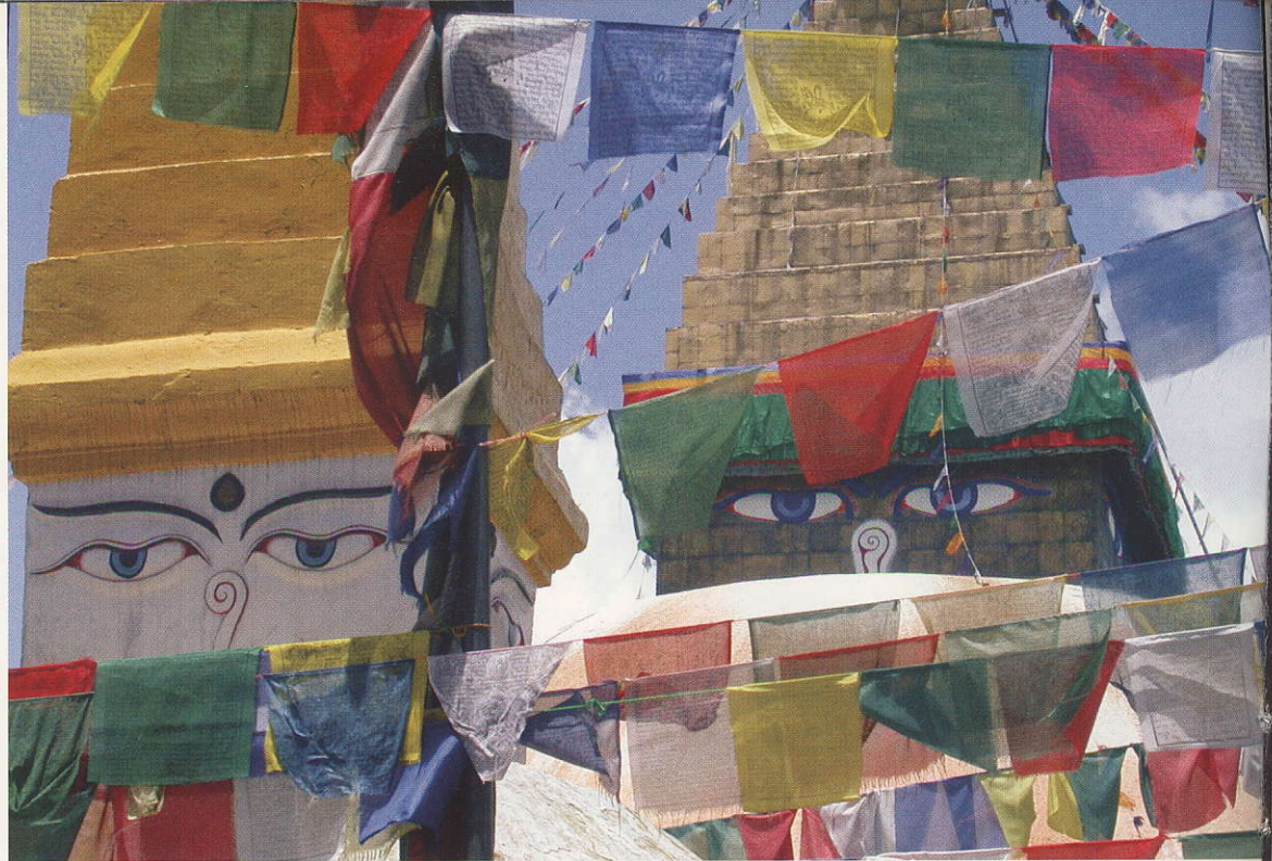
בַּעֲמוֹד מִימִין: כְּדָאֵי לְהַסְפִּיק לְמַקְלַחַת הַבּוֹקֵר שֶׁל פֶּסֶל וִישְׁנו בְּבוּדַהָ נִילָה קְהֲאֲנָתָה