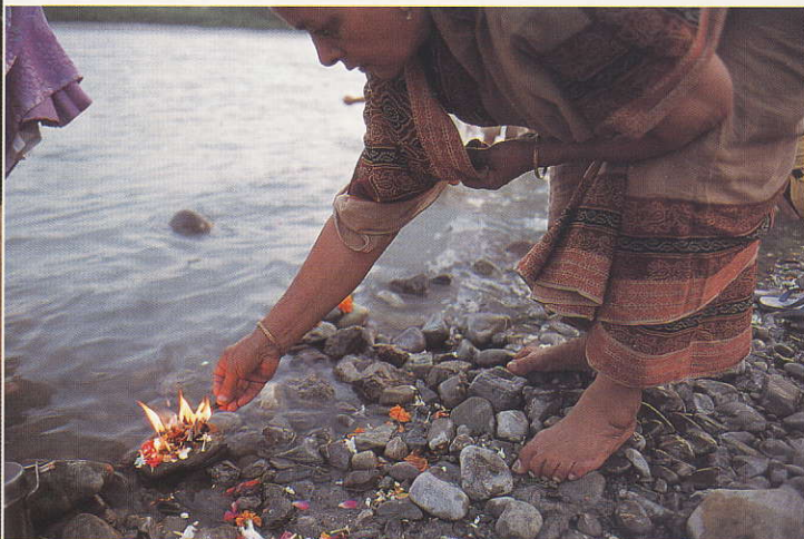
מאמינים הינדים משיטים על מי הגנגס קערות קטנות עם פרחים, נרות וממתקים

נהר הגנגס, הקדוש להינדים, מתחיל בקרחון הנמצא במרומי הרי ההימלאיה. ההגעה למקום המרוחק קשה, ולכן היא בעלת ערך רב בעיני המאמינים.