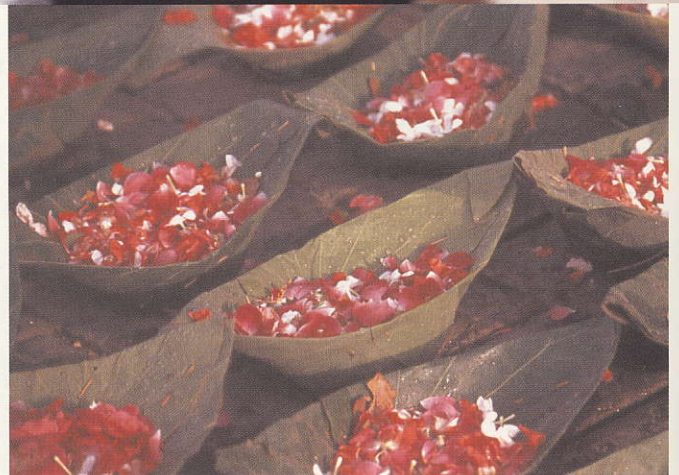
מְנַחוֹת שֶׁל פְּרָחִים עַל נְהַר הַגְּנוּס

בְּאוֹתָם יָמִים הוֹרְשׁוּ הַכּוֹהֲנִים לַעֲסוֹק בַּעֲבוּדַת הַמִּקְדָּשׁ רַק לְאַחַר שֶׁטִּבְלוּ בַּמִּקְוֶה. גַּם בַּיּוֹם, לִפְנֵי תְּפִילוֹת מְסוּיָמוֹת בְּבֵית הַכְּנֶסֶת – בַּעֲיָקוֹר בְּעָרֵב שַׁבָּת, בְּרֵאשׁ הַשָּׁנָה וּבַיּוֹם הַכִּיפּוּרִים – עַל הַמַּתְפַּלְלִים לְהַגִּיעַ רְחוּצִים, לְאַחַר טְבִילָה. חוּבָה עֲלֵיהֶם לְקַבֵּל אֶת הַיָּמִים הַקְּדוּשִׁים הַלְלוּ כְּשֶׁגּוֹפֵם וְנִפְשָׁם נִקְיִים, וְכִשְׂמַחְשׁוֹבוֹתֵיהֶם וְכַוְנוֹתֵיהֶם צְלוּלוֹת כְּמִים. ©