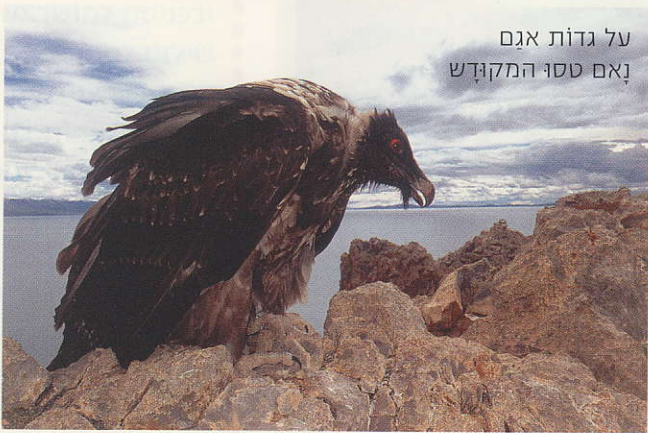
על גדות אגם נאם טסו המקודש