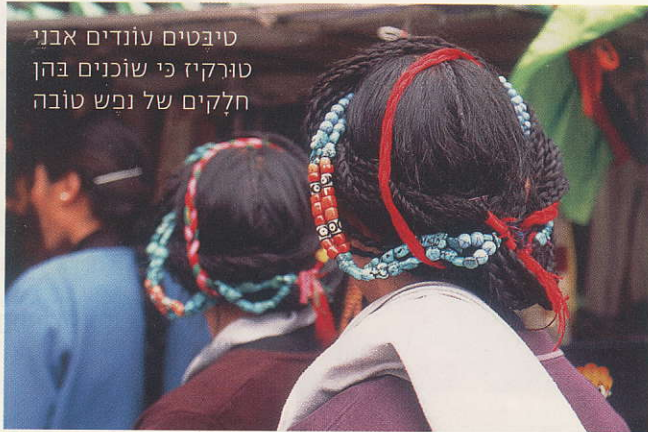
טיבטים עונדים אבני טורקיז כי שוכנים בהן חלקים של נפש טובה